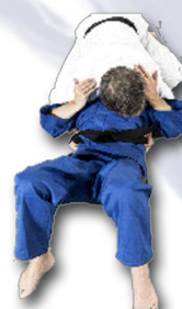
«Le casque» Kami-shiho-gatame