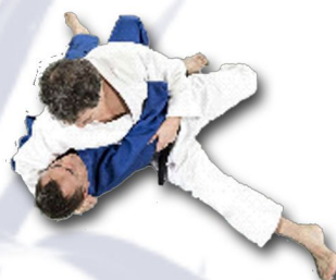
«Sauteur de haies» Hon-gesa-katame