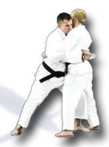
Défense sur saisie de face