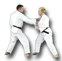
Défense sur saisie du revers

Je sais construire deux enchainements dans les situations suivantes :