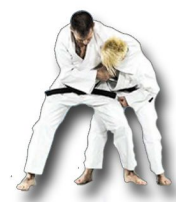
Défense sur saisie de côté