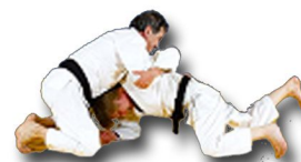
Retournement de face