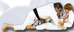
Renversement partenaire entre les jambes